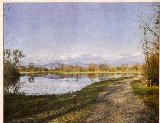
Les points de vue sont nombreux et contrastés, tout le long du sentier, selon les endroits et les saisons.