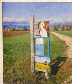
Tout au long du sentier, des panneaux informent les promeneurs.